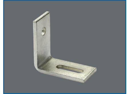
Montagewinkel 3 Maß 70 x 70 x 35 x 5 mm, Stahl vz. 1 Längloch 10 x 35 mm 1 Rundloch 10 mm