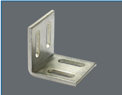
Montagewinkel 4 Maß 70 x 70 x 60 x 5 mm, Stahl vz. 4 Länglöcher 10 x 35 mm