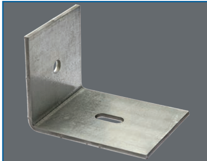
Montagewinkel 5 Maß 100 x 130 x 100 x 5 mm, Stahl vz. 1 Längloch 3 x 13 mm 1 Rundloch 10 mm